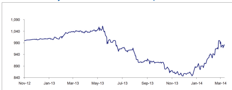
Kinerja Kiwoom Indonesia Optimum Fund