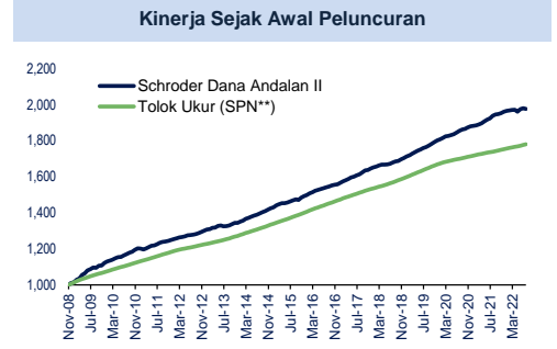
Grafik kinerja dihitung dengan mengikutsertakan dividen yang direinvestasikan.

INFORMASI LEBIH LENGKAP DAPAT DILIHAT DI PROSPEKTUS YANG DAPAT DI AKSES DI WWW.SCHRODERS.CO.ID